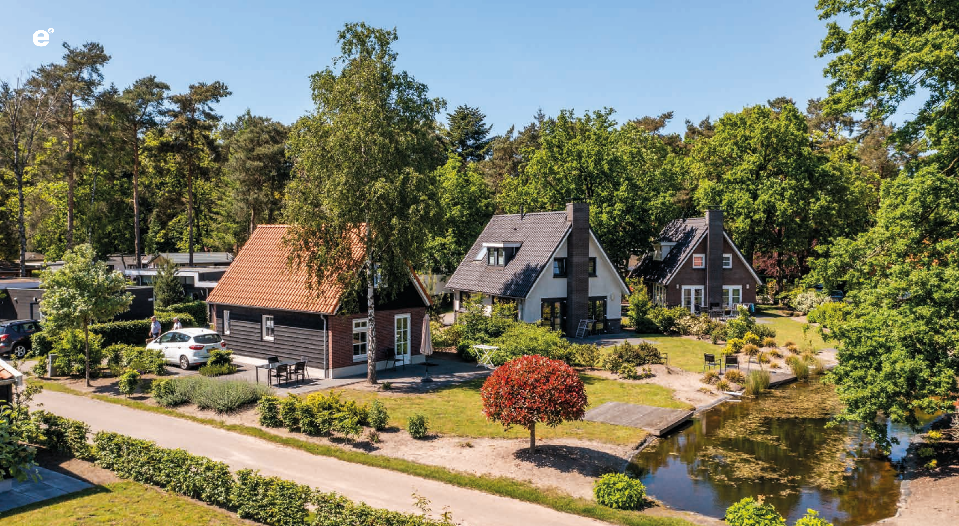
EuroParcs De Achterhoek, Lochem