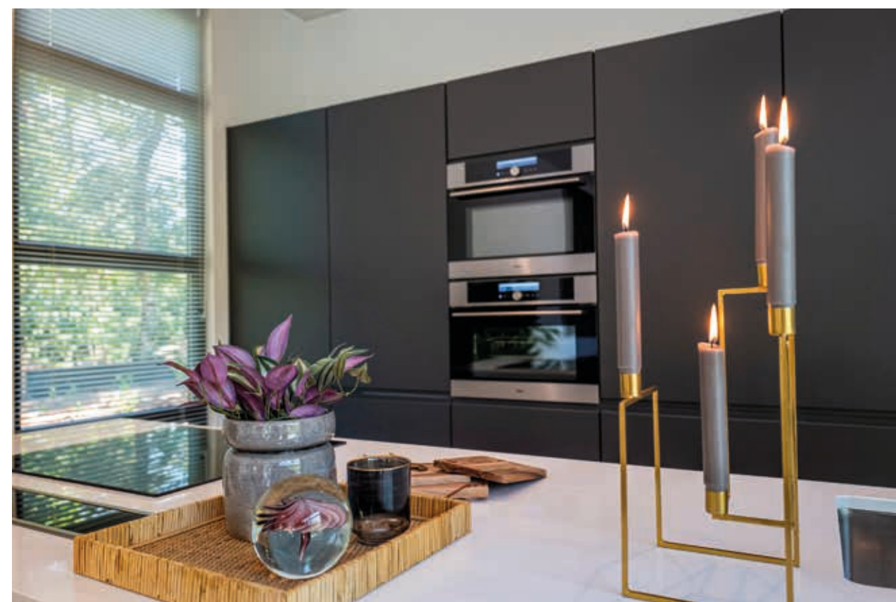
Onder en boven: interieur mindervalide woning EuroParcs Beekbergen